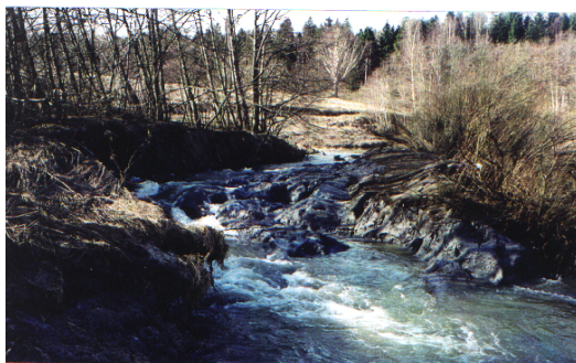
Jordras på Rundtommen. Bildet er hentet fra dokumentet i NVE

For at NVE skal yte midler, kreves det at kommunen står som søker og tiltakshaver.