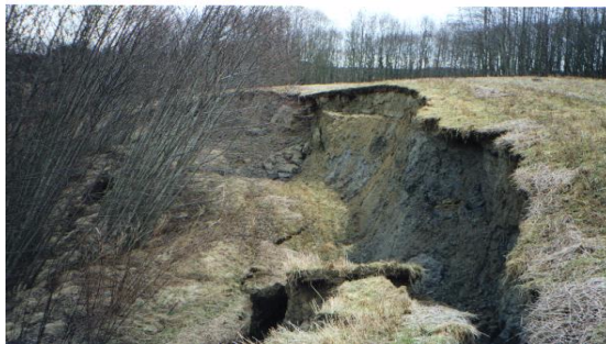
Jordras på Rundtommen. Bildet er tatt i mars 2000.

Men Rundtommen har mer interessant å by på. I utløpet av Reinebekken finnes en Beverkoloni. De formerer seg raskt og har allerede voldt betydelig skade på trærne. Det er jakttillatelse på dyrene. To bevere er skutt. Begge er stoppet ut og er plassert i klubbrommet!